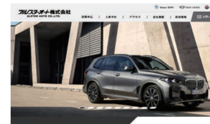
愛媛BMW(アルスターオート株式会社)様 コーポレートサイト