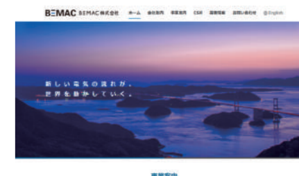
BEMAC株式会社様 コーポレートサイト