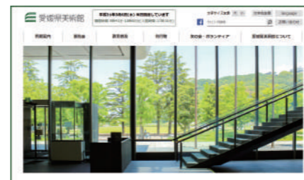
愛媛県美術館様 公式サイト