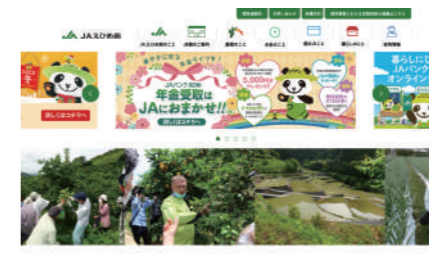
えひめ南農業協同組合様 コーポレートサイト