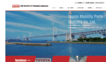
トヨタモビリティパーツ株式会社 四国統括支社様 コーポレートサイト