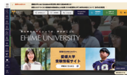
国立大学法人愛媛大学様 公式サイト