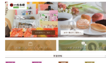
株式会社一六本舗様 コーポレートサイト