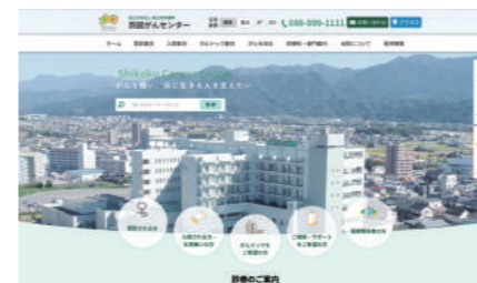
独立行政法人国立病院機構四国がんセンター様 公式サイト

2000年の設立から今日まで、愛媛県の優良企業様を中心に1,000件以上のホームページを立ち上げて参りました。その用途もコーポレートサイト、リクルートサイト、ショッピングサイト、会員サイトなど、多岐に渡ります。こちらに掲載している実績は一例です。