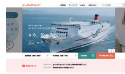
四国開発フェリー株式会社様 オレンジフェリーサイト